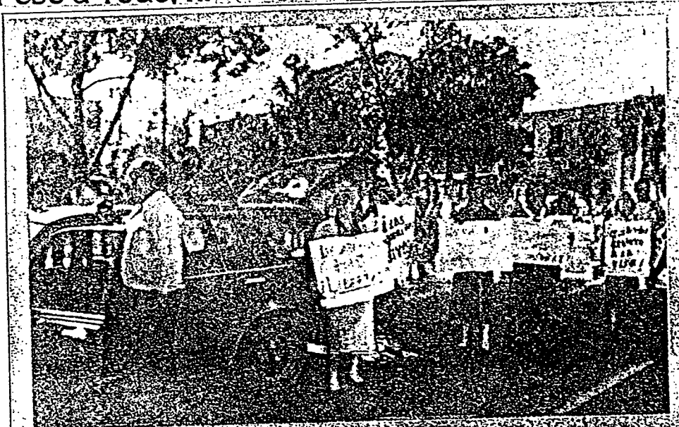
MADRES DE desaparecidos políticos se plantaron ayer frente al Palacio de Gobierno exigiendo la libertad — sanos y salvos — de sus hijos de los que dijeron son presos políticos. Vea "SUS MADRES" Página 2-3